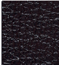
DARK BROWN M4401