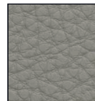
LIGHT BEIGE H355