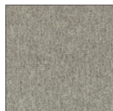
LIGHT GREY D304