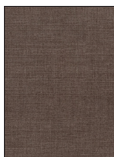
DARK BROWN R460