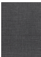
DARK GREY R465