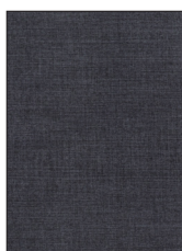
DARK BLUE R452