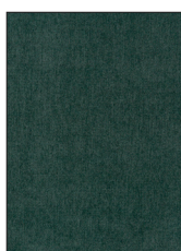
RACING GREEN F196