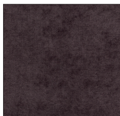
DEEP BROWN G701