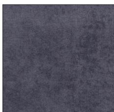
DEEP BLUE G705