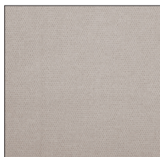
LIGHT GREY F221