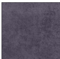
DEEP BLUE G705