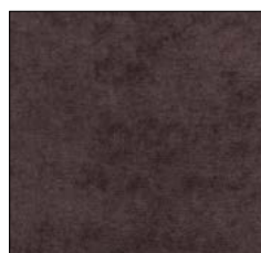
DEEP BROWN G701