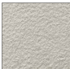
CLOUD DANCER G230

In der warentypischen Eigenschaft und im Gebrauchsverhalten neigt Flachgewebe zu einer gewissen Flusigkeit, die bis zur Knötchenbildung (Pilling) führen kann. Ebenso können Fremdfasern von dem Material angelagert werden. So entstandene Knötchen werden mit einem Fusselgerät entfernt. Eine derartige Fasereigenschaft berechtigt nicht zur Reklamation. Fremdfärbung durch Kissen und/oder Bekleidungsstoffe ist kein Mangel des Bezugsmaterials. Farb- und Strukturabweichungen sind warentypisch und berechtigen nicht zu Reklamationen.