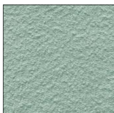
IRISH MINT G240