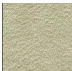
LEMON SORBET G242