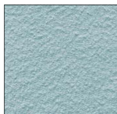
ALICE BLUE G241