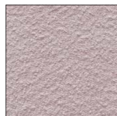
PALE PINK G243