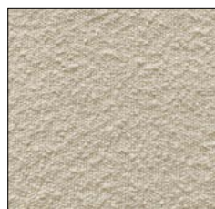
VANILLA ICE G231