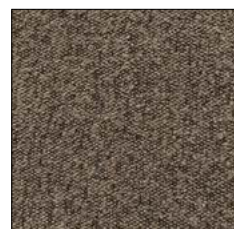
SEPIA TINT G233