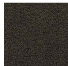
COFFEE BEAN G234