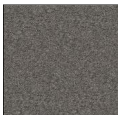
DARK GREY F057