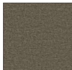
DARK GREY H311