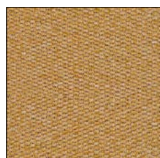
GOLDEN ORANGE D265