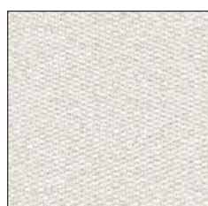
SILVER LINING D263