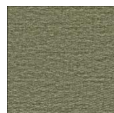
BURNT OLIVE D266