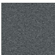
EIFFEL TOWER D262

Attenzione: cucitura a contrasto solo per i modelli omologati.